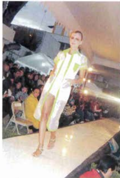
Las transparencias fueron parte primordial de la tendencia