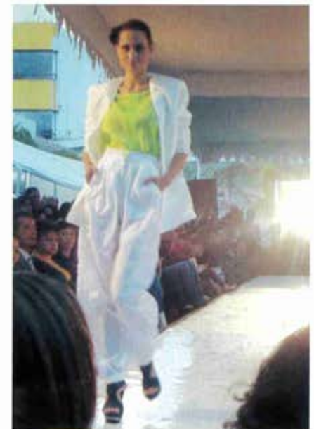
Los pantalones fueron de los más aplaudidos