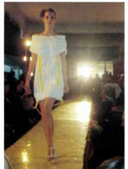
Alumnas de séptimo semestre se llevaron la noche.