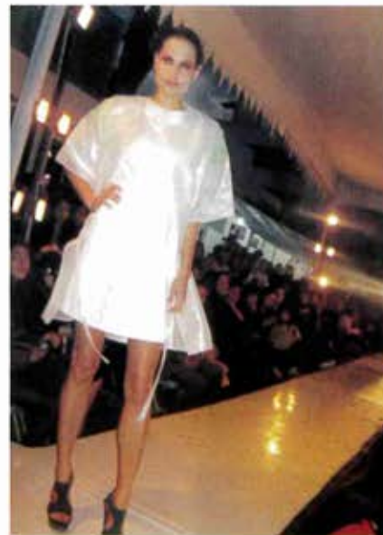
Los espectadores siguieron de cerca cada uno de los outfits