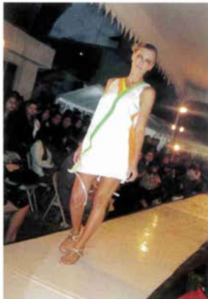
Los alumnos de tercer semestre apostaron por los materiales plásticos