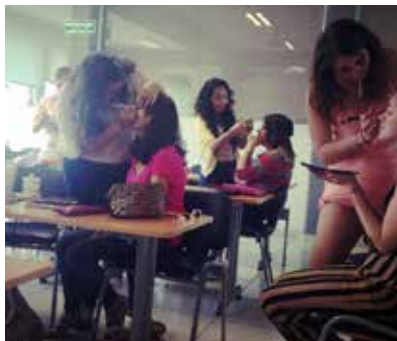
Sombra aquí, sombra allá #maquillate, maquillate. Las chicas de diseño de imagen trabajando arduo en sus clases.