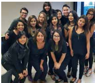
Los chicos de Diseño y Asesoría de imagen trabajando para causas nobles. Aquí el #crew de TROZMER participando en el desfile de personas con capacidades diferentes organizado por Anette Castro.