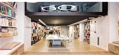
Universidad LCI, Barcelona España lci-barcelona.com