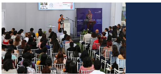
Universidad Chiolecca, Lima Perú chio-lecca.edu.pe