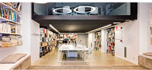
Universidad LCI, Barcelona España lci-barcelona.com