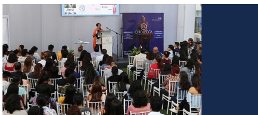
Universidad Chiolecca, Lima Perú chio-lecca.edu.pe