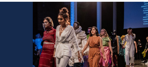
Institut Català de la Moda, Barcelona España incatmoda.com/es