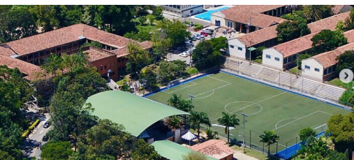
Instituto Universitario Pascual Bravo, Medellín Colombia pascualbravo.edu.com