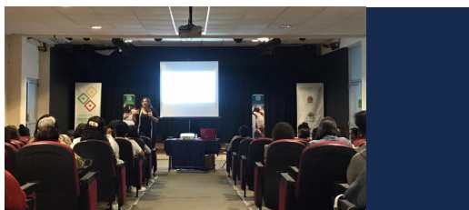
Instituto Superior de Estudios Creativos, Cancún México estudiocreativocancun.com